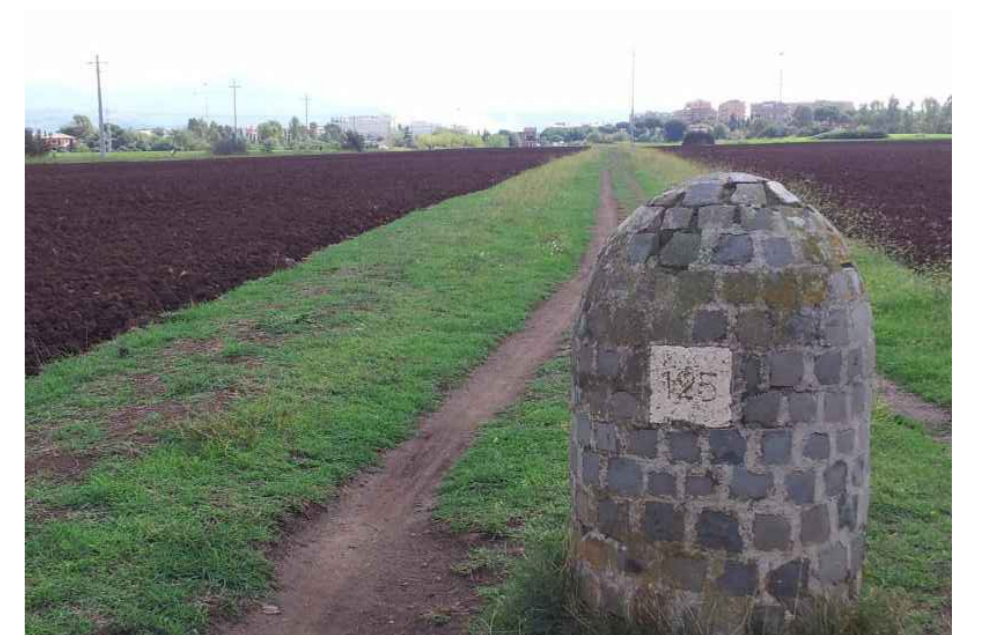
FOTO 04 - Cippo con il n. 125: SITUATO ALL'INTERNO DEL PARCO DEGLI ACQUEDOTTI, POCO OLTRE L'INGRESSO DA VIA DELLE CAPANNELLE (ALTEZZA VIA LUCREZIA ROMANA)