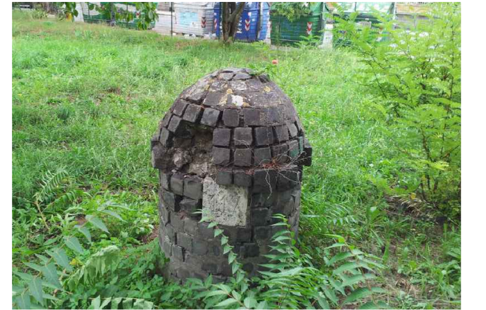
FOTO 03 - Cippo con il n. 117: SITUATO IN UN TERRENO ADIACENTE A VIA DEL CASALE FERRANTI, ANGOLO VIA GIRIFALCO: