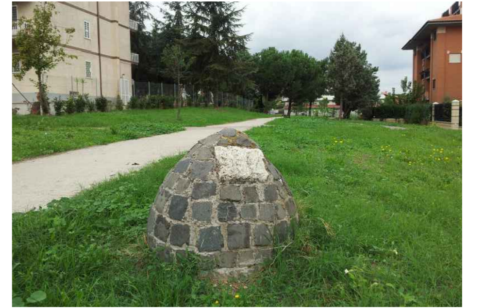
FOTO 02 - Cippo con il n. 114: SITUATO NEL PARCO DI VIA SOVERIA MANNELLI, SUBITO DIETRO LA FERMATA ATAC DI VIA CINQUEFRONDI: