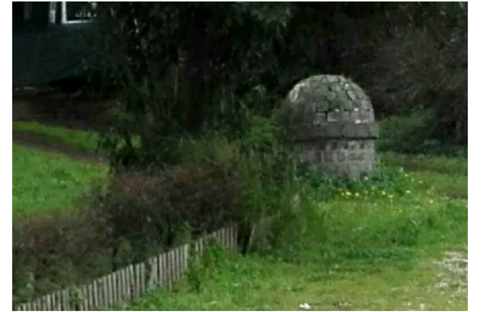
FOTO 01 - Cippo con numero sconosciuto: SITUATO ALL'INTERNO DELLA CASA DI RIPOSO PER ANZIANI IN VIA ROGGIANO GRAVINA