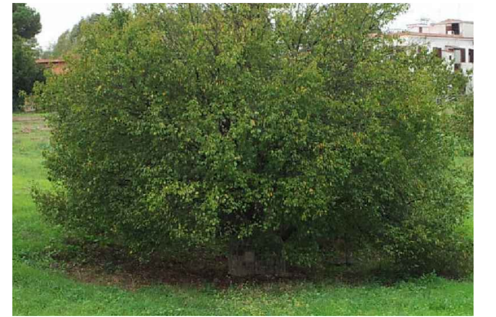
Cippo con numero sconosciuto: SITUATO NEL TERRENO SOTTOSTANTE IL PARCO GIOCHI DI VIA PELLARO