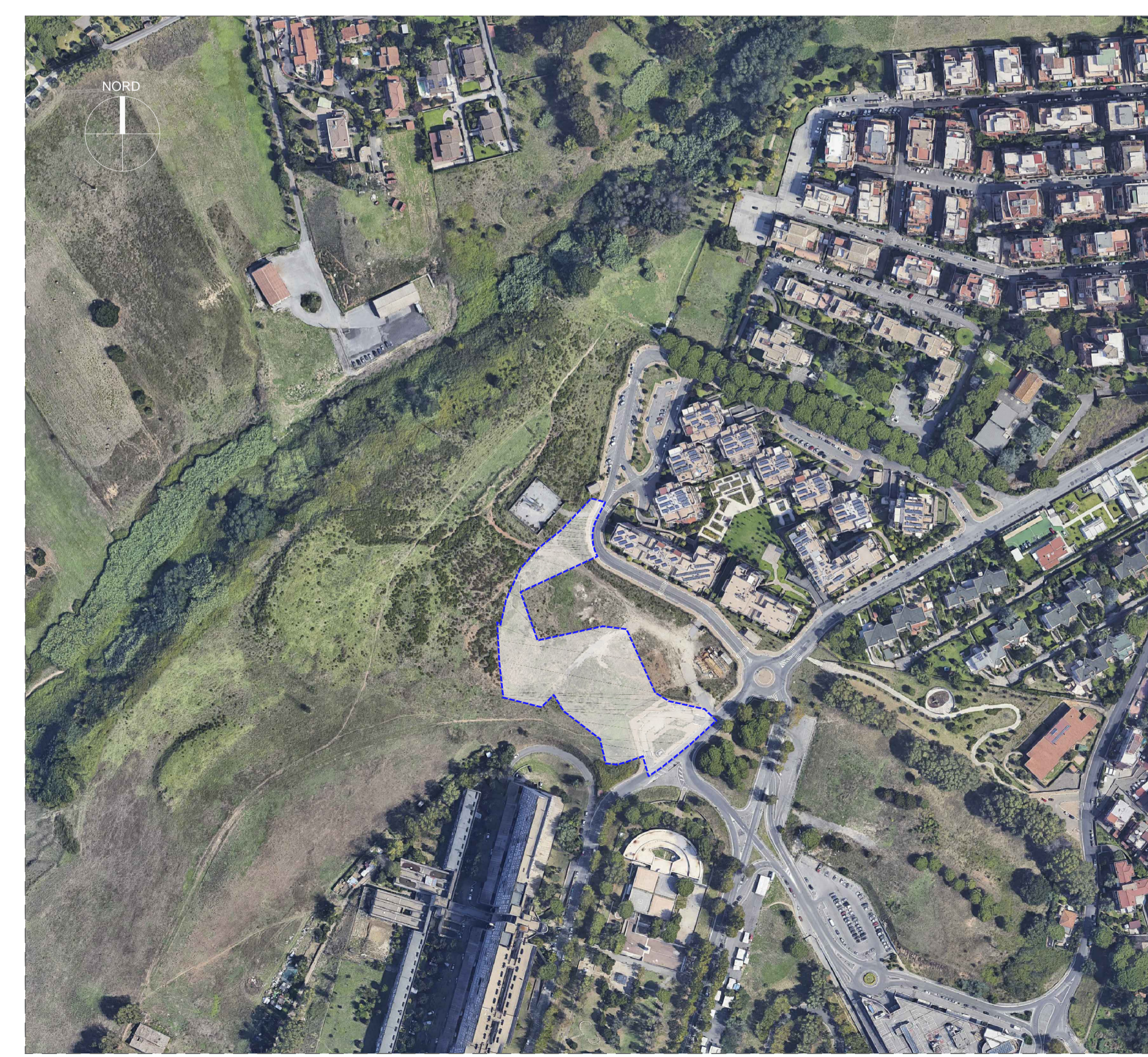
FOTO SATELLITARE CON PERIMETRAZIONE DELL'AREA DI PROGETTO