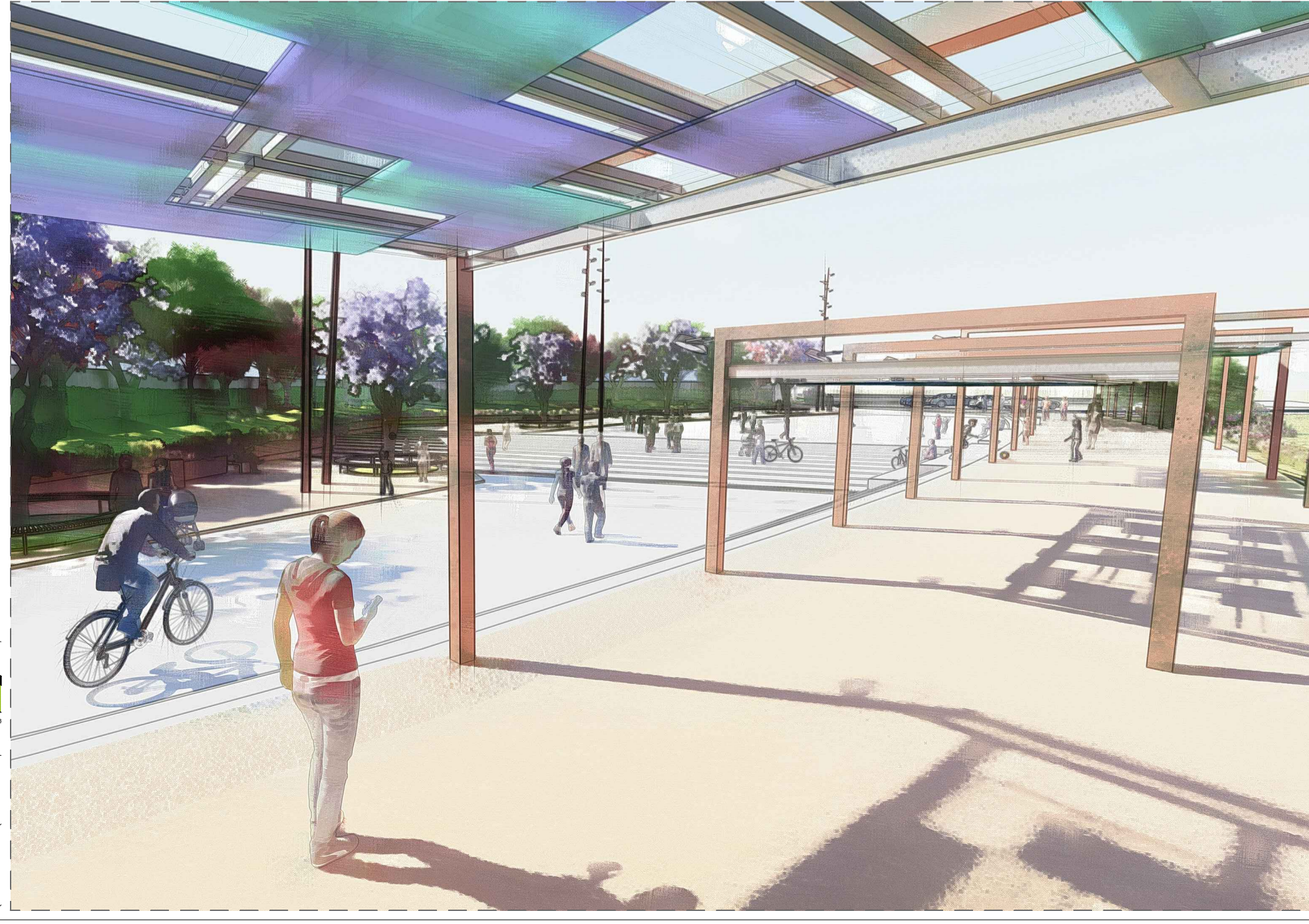
IL CINEMA LAYOUT DELLA PIAZZA IN OCCASIONE DI UNA PROIEZIONE CINEMATOGRAFICA