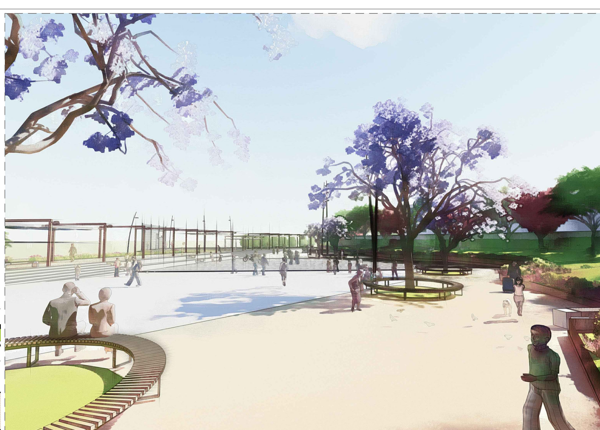
IL MERCATINO LAYOUT DELLA PIAZZA NEI GIORNI DI MERCATO