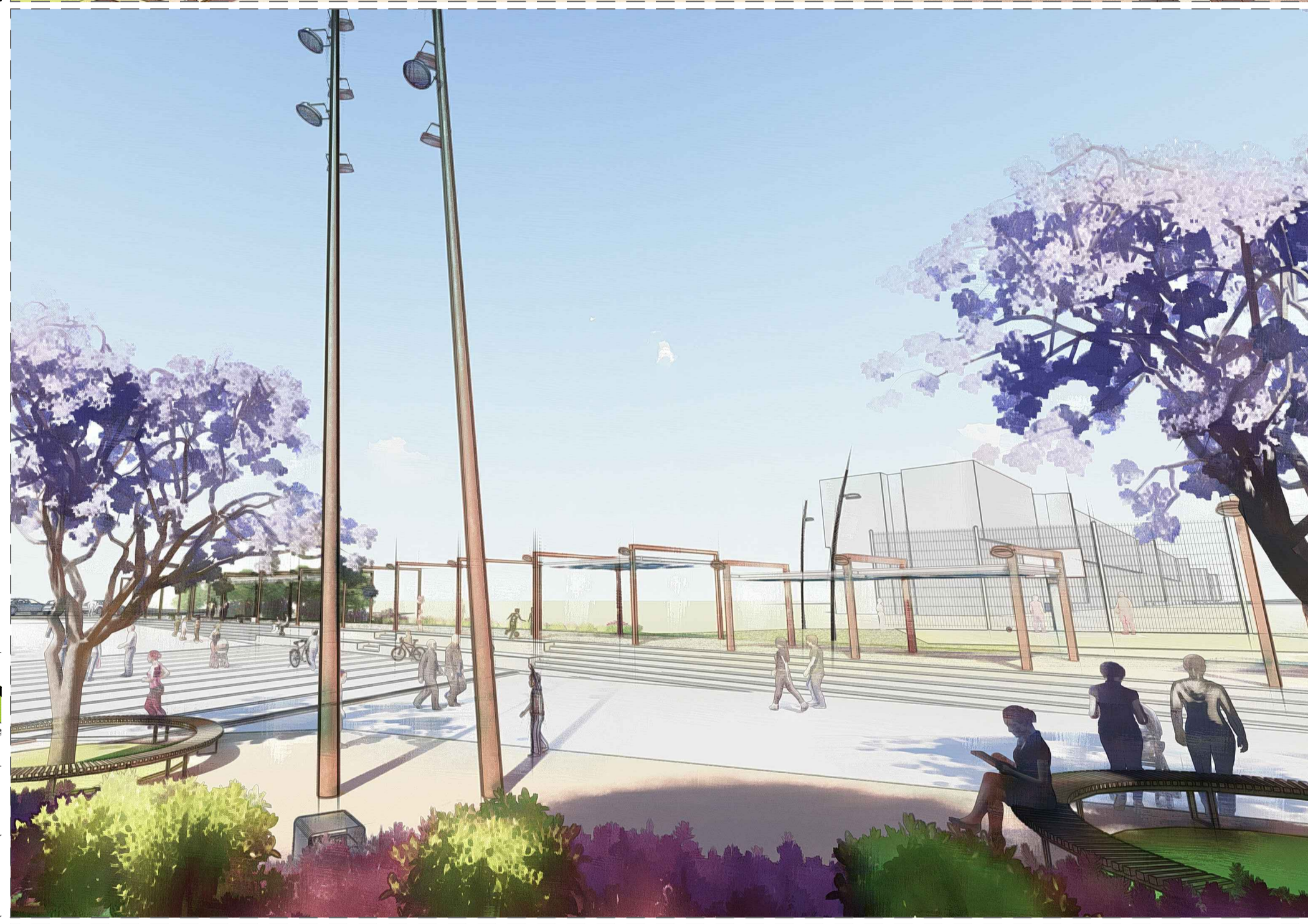
IL CONCERTO LAYOUT DELLA PIAZZA DURANTE UN CONCERTO