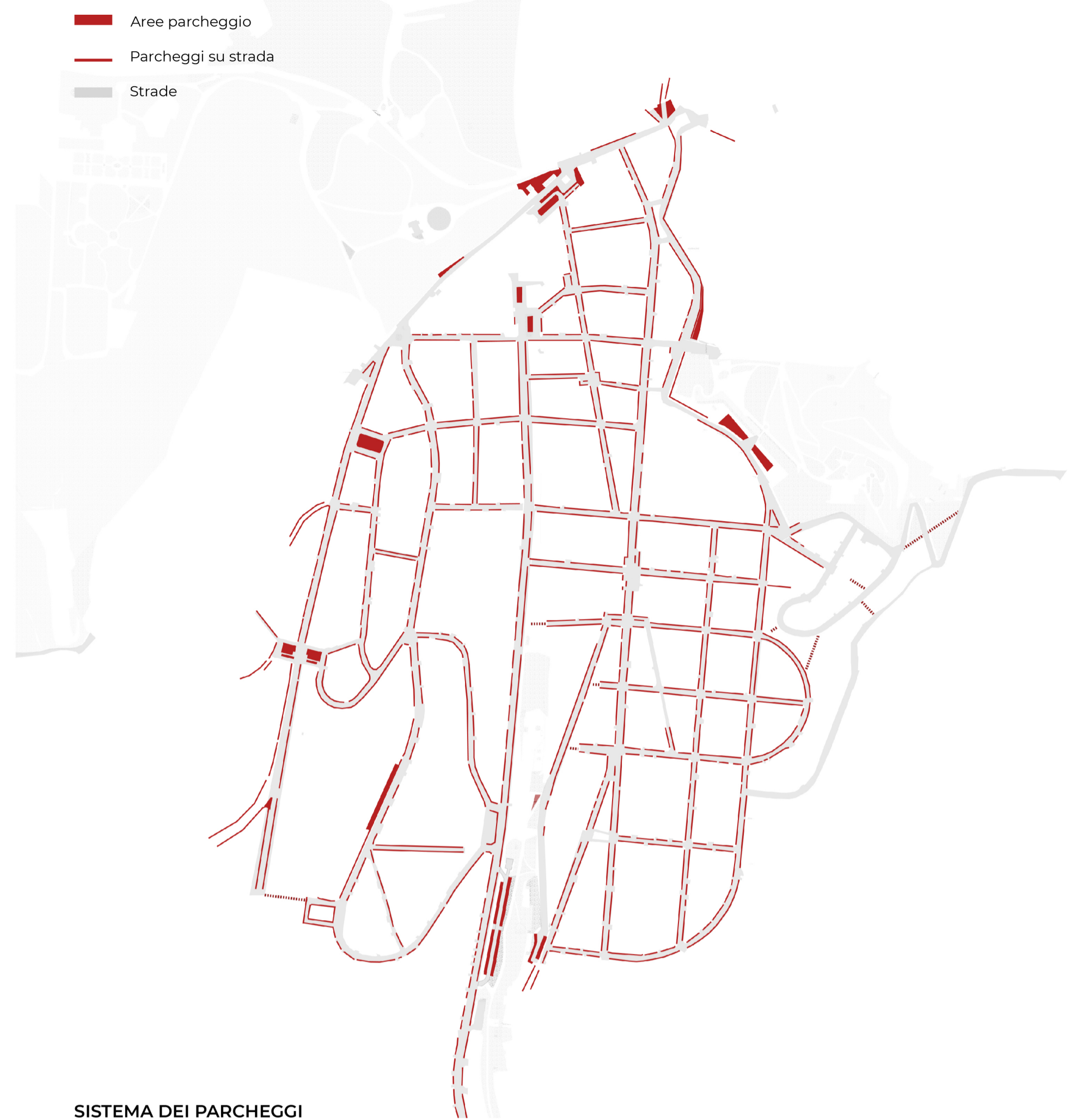
SISTEMA DEI PARCHEGGI