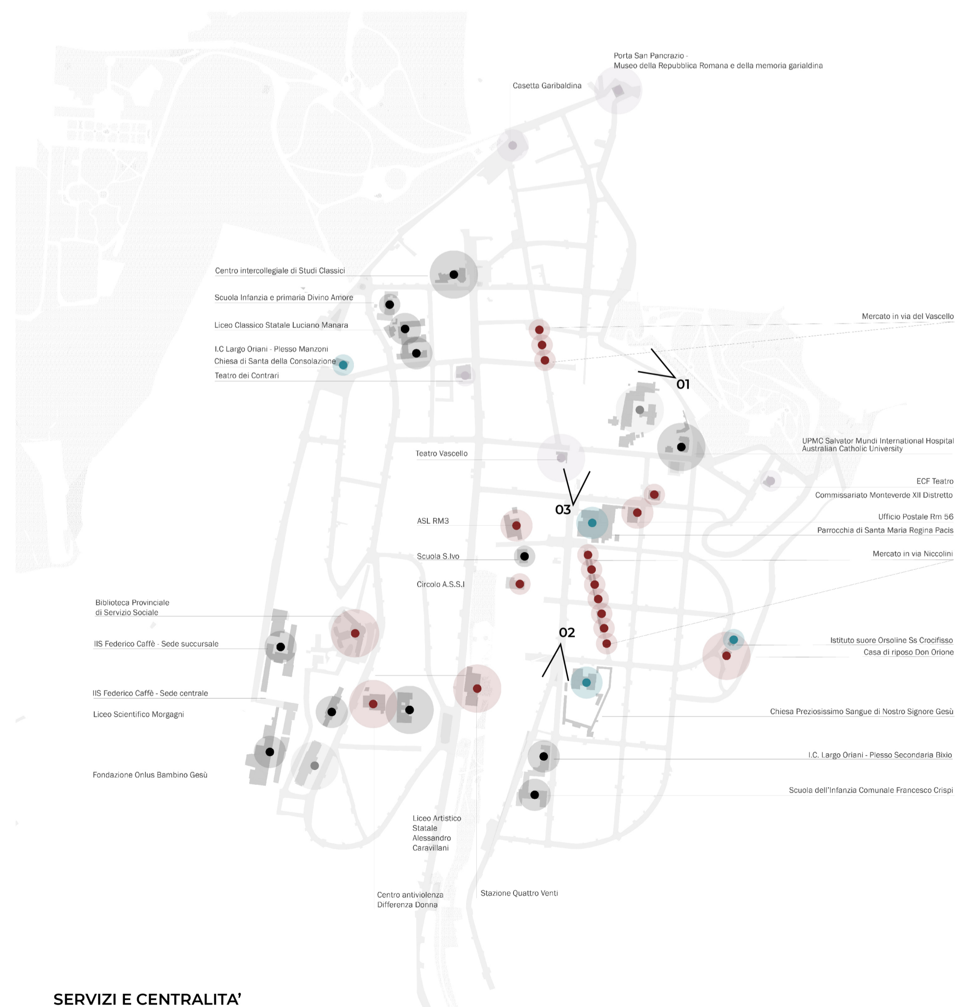
SERVIZI E CENTRALITA'