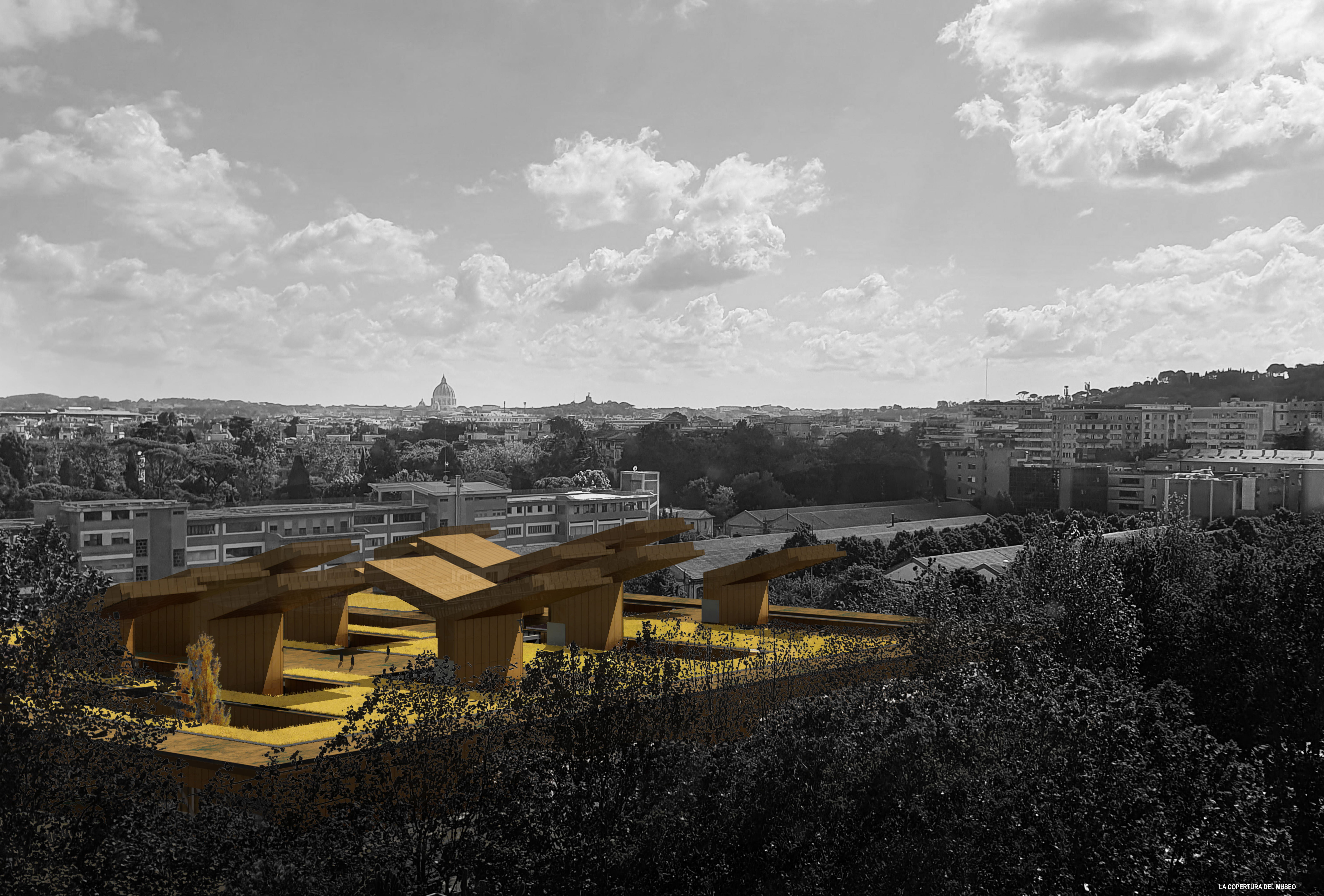
LA COPERTURA DEL MUSEO

Il nuovo MSR offre un ambiente aperto allo scambio dinamico con la città e i suoi diversi fruitori. Grazie al Giardino Pensile Solare, lo spazio esterno del MSR si estende fino a conquistare lo scenario dell'intera ansa del Tevere e del profilo di Monte Mario cosicché, per giacitura e dimensioni, la copertura abitata diventa il baricentro di un asse che rafforza la strategia urbana che punta a connettere la vita quotidiana e la cultura che si esprime nei suoi molteplici volti: l'Auditorium, la grande architettura del Villaggio Olimpico, gli spazi pubblici del Palazzetto dello Sport e del Viadotto di Pier Luigi Nervi, e poi, proseguendo oltre viale Tiziano, il MAXXI, il nuovo Museo della Scienza, il Ponte della Musica.