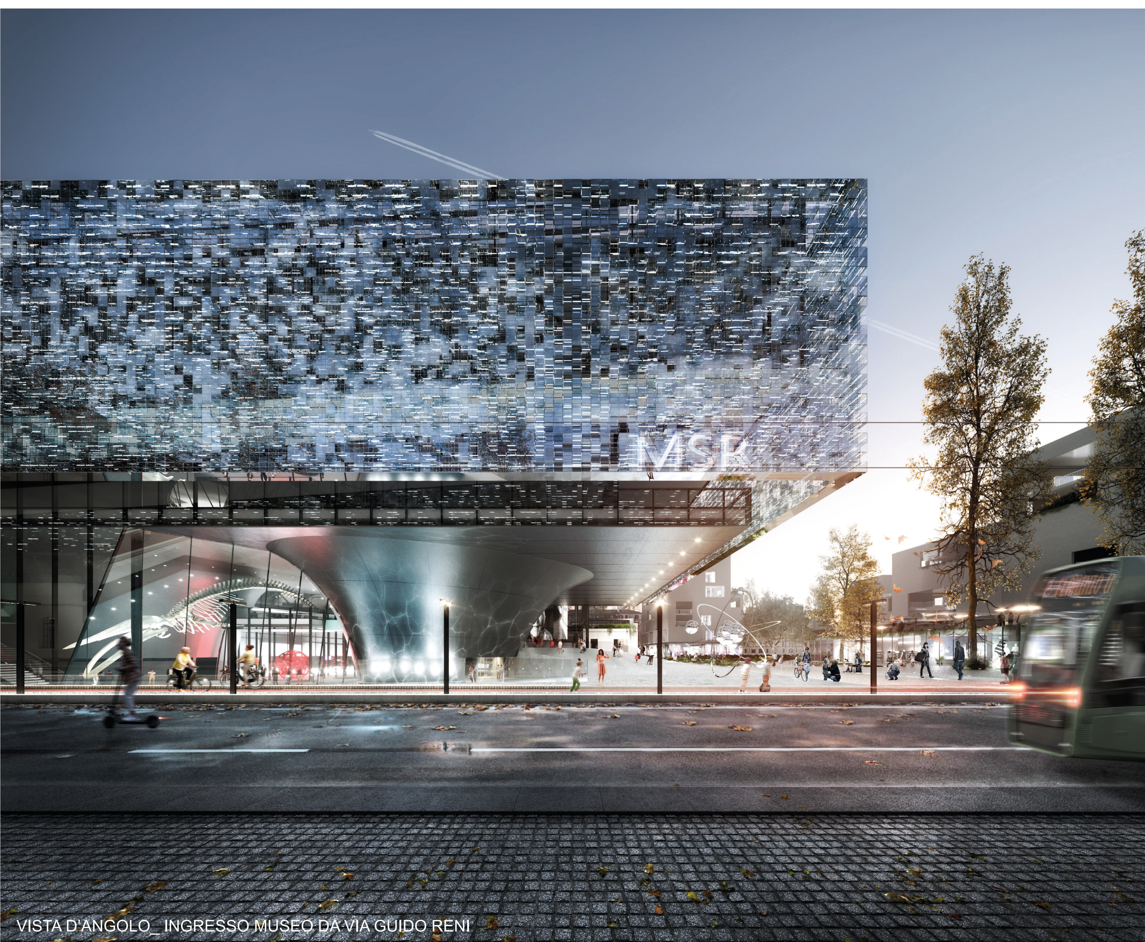
VISTA D'ANGOLO _INGRESSO MUSEO DA VIA GUIDO RENI

La flessibilità interna è garantita, oltre che dalla diversificazione degli accessi, anche dalla possibilità di utilizzare le sale espositive sia in modo integrato che indipendente. La parte delle esposizioni temporanee è organizzata ad esempio su due livelli tra loro connessi (al PT e P1), che potranno essere separati e accessibili in modo indipendente. Anche le esposizioni permanenti potranno essere collegate o accessibili in modo indipendente, e potranno anche essere separate in sale più piccole allo stesso livello. In questo modo le esposizioni potranno avere superfici molto diverse a seconda delle esigenze, ed i visitatori potranno accedere direttamente alle sale di loro interesse tramite appositi corpi scala e ascensori, senza dovere attraversare tutto il Museo.