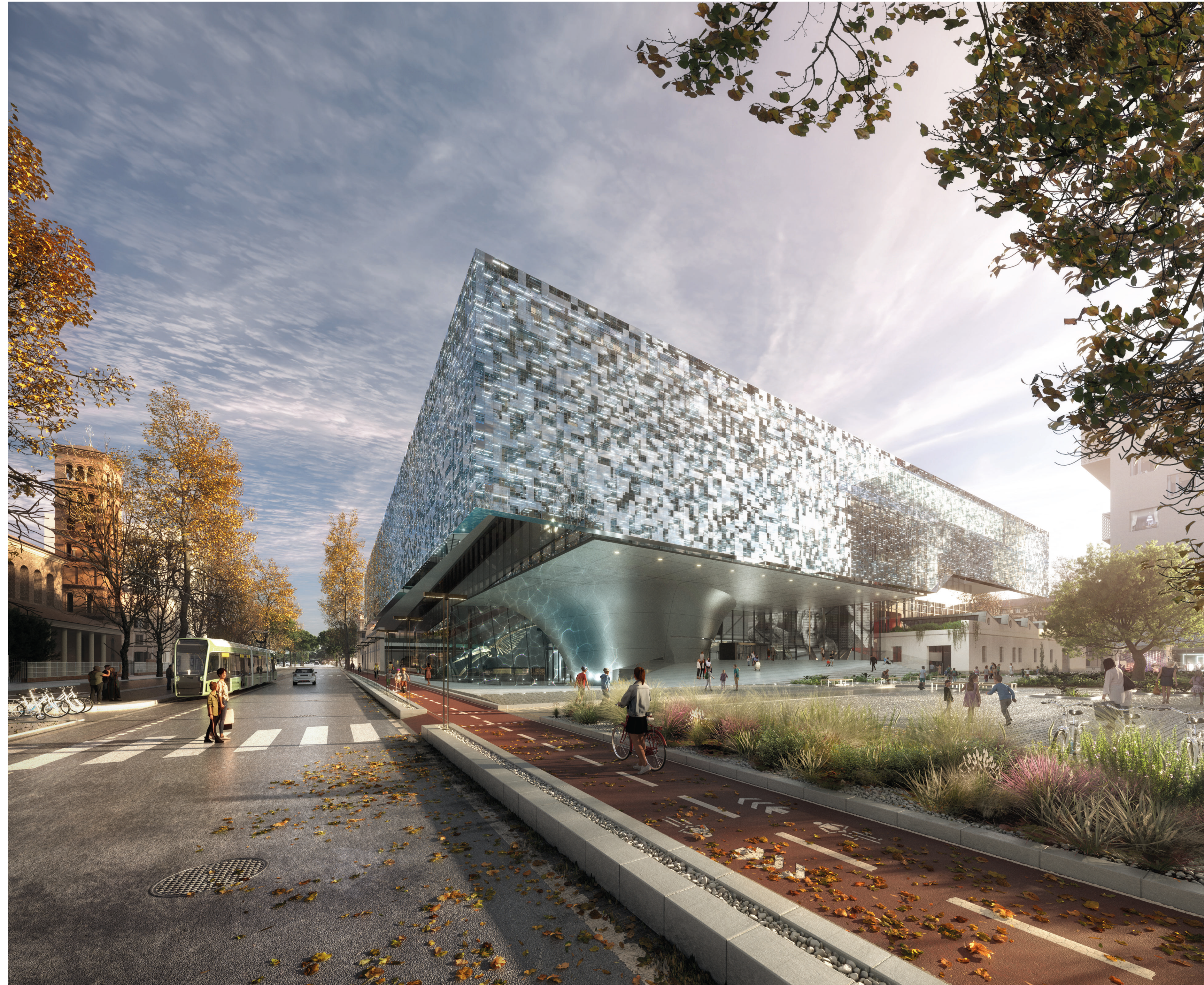
VISTA FRONTALE _INGRESSO MUSEO DA VIA GUIDO