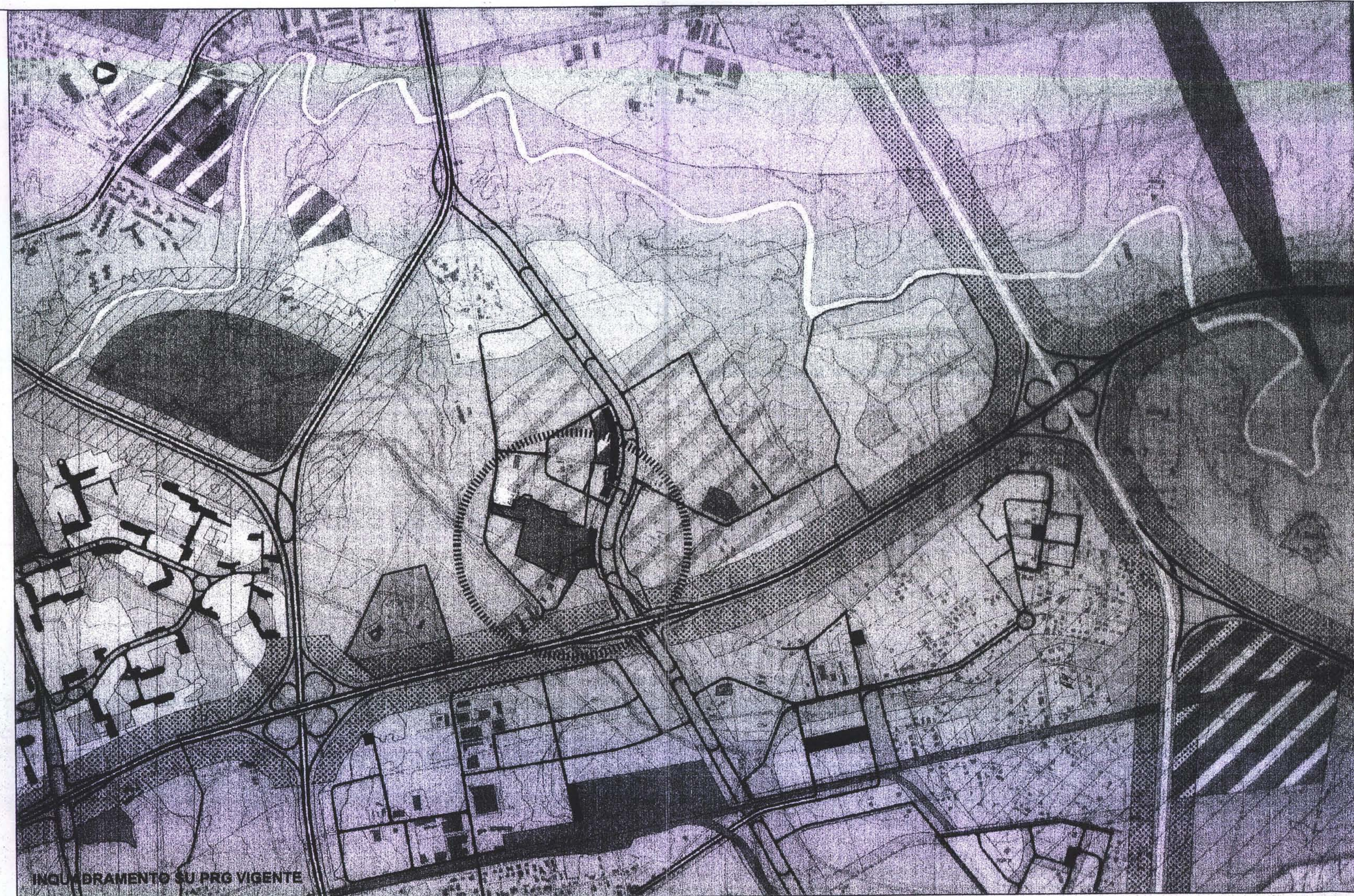
INQUADRAMENTO SU PRG VIGENTE