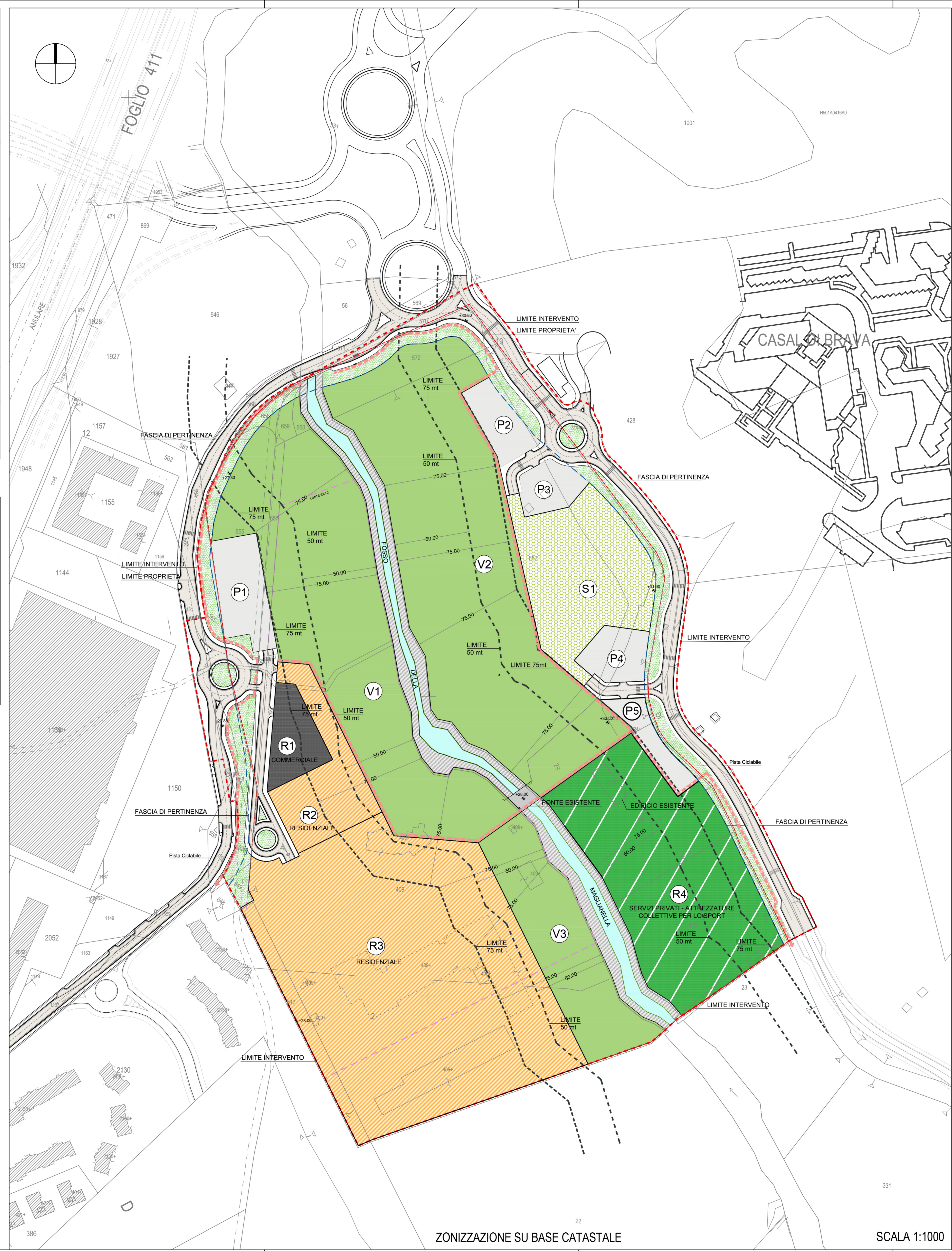
ZONIZZAZIONE SU BASE CATASTALE