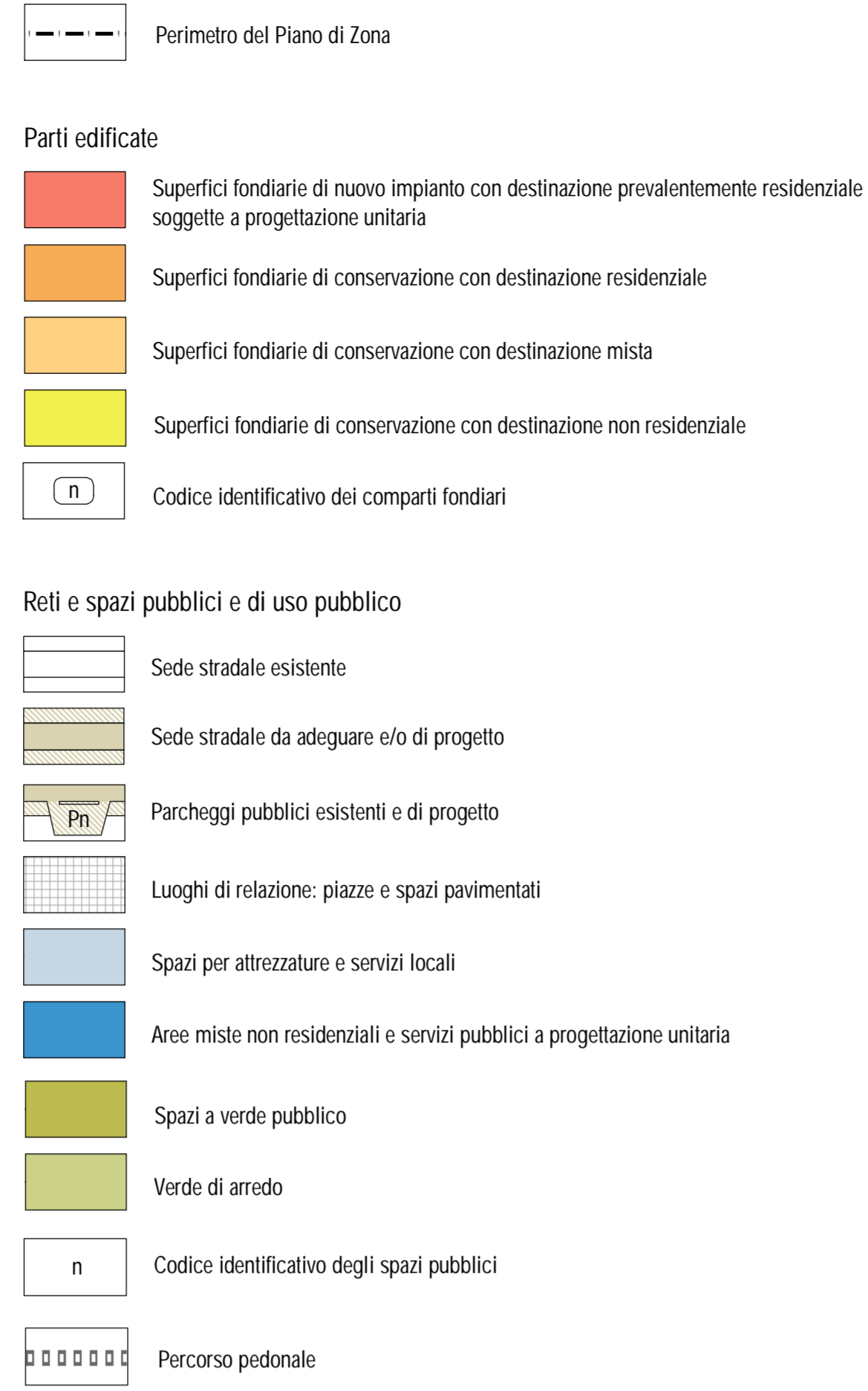
TAB. 1 DATI GENERALI PIANO DI ZONA

Elab.5 Partizione e modalità d'uso degli spazi pubblici e privati zonizzazione su base catastale scala 1:2.000