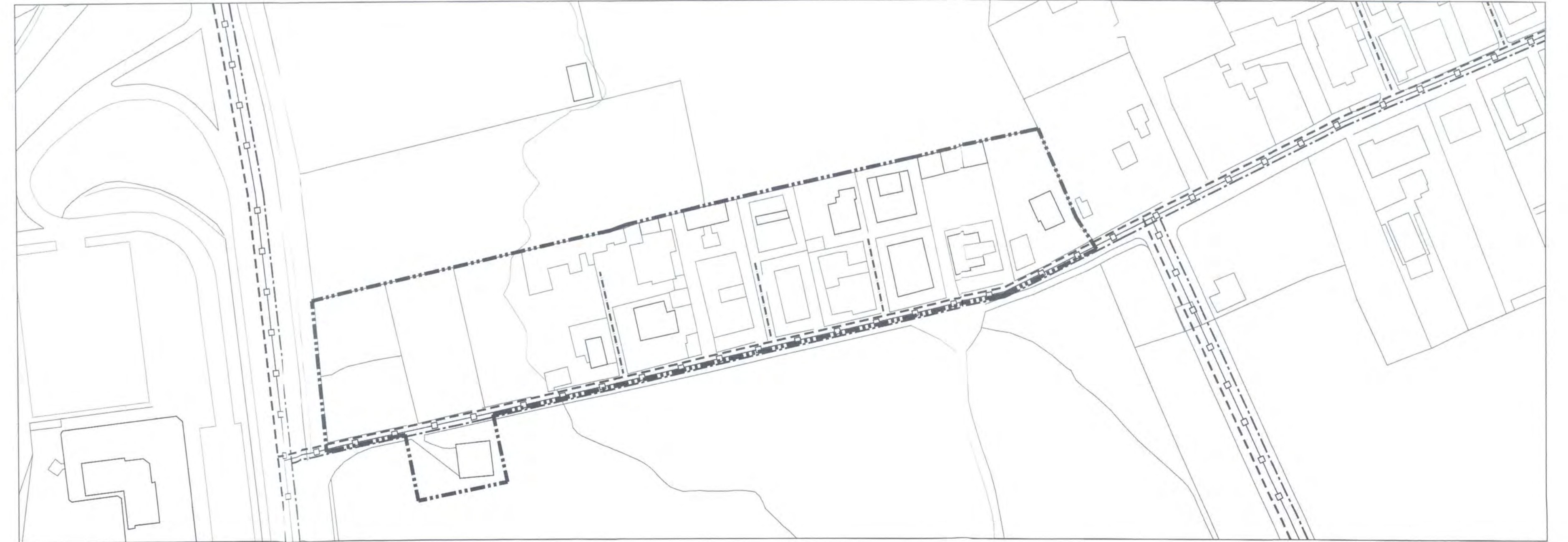
"Cartesio CTR Aggiornato 2008" - Rapp. 1:1.000