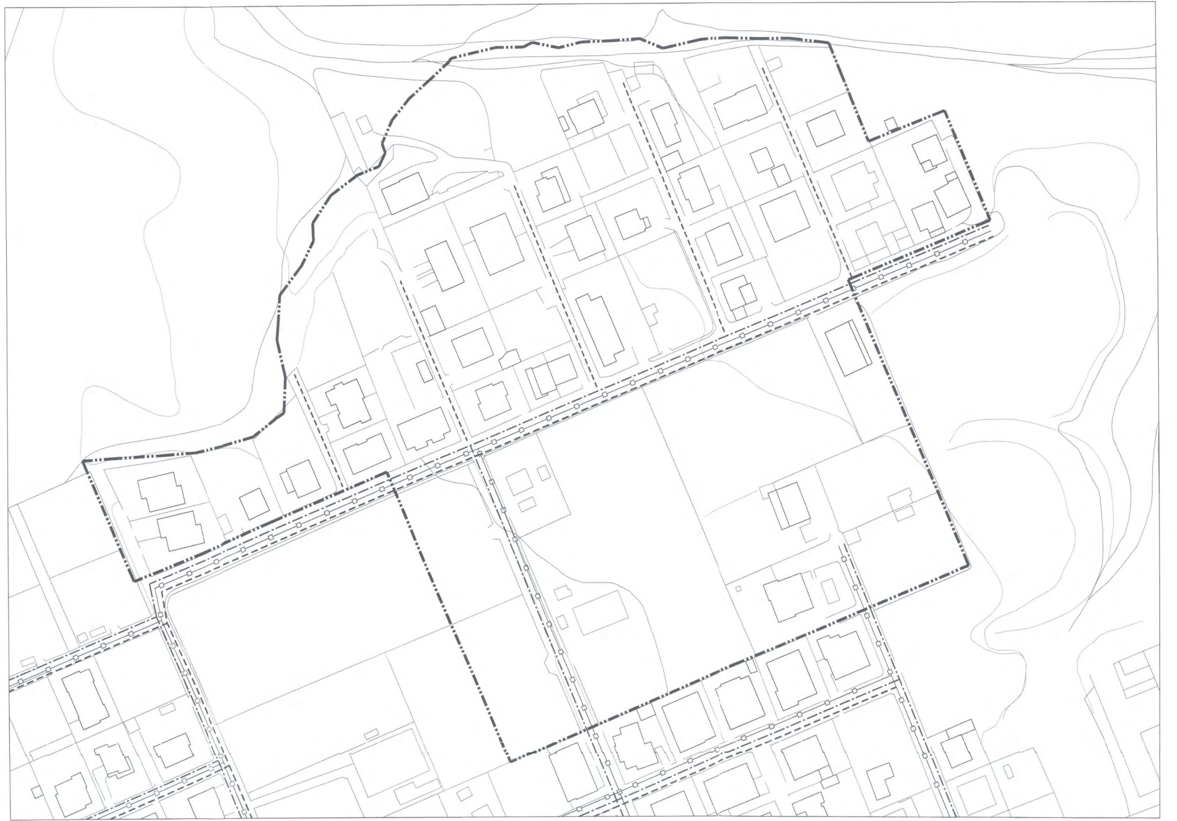
"Cartesio CTR Aggiornato 2008" - Rapp. 1:1.000