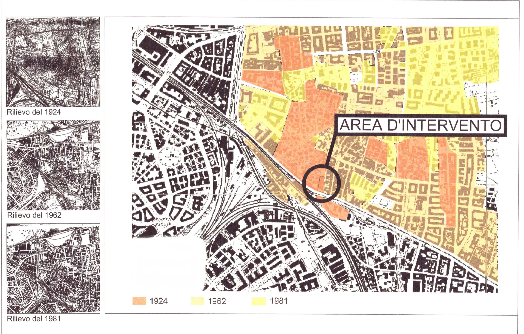
TAVOLA CRONOLOGICA - CRESCITA URBANA